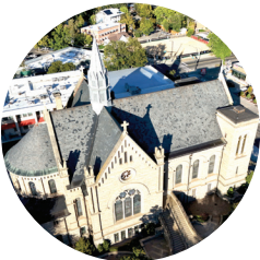
CATHEDRAL OF ST. JOHN THE EVANGELIST 807 N. 8TH STREET • BOISE

Una vez en el lugar, el peregrino puede hacer varias cosas: